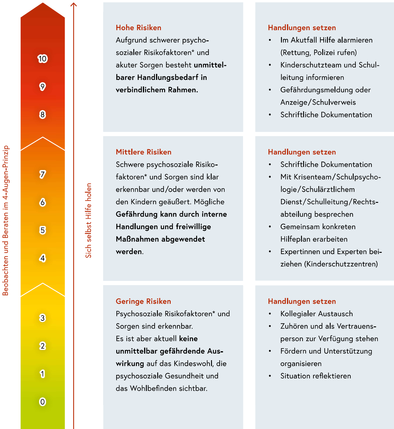
Abbildung: Sorgenbarometer

* Psychosoziale Risikofaktoren siehe Leitfaden Kinderschutz und Schule, Punkt 3. Symptome & Folgen von Gewalt: Sichtbare (körperliche) Hinweise, Anzeichen im Leistungsbereich, emotionale und soziale Verhaltensauffälligkeiten.